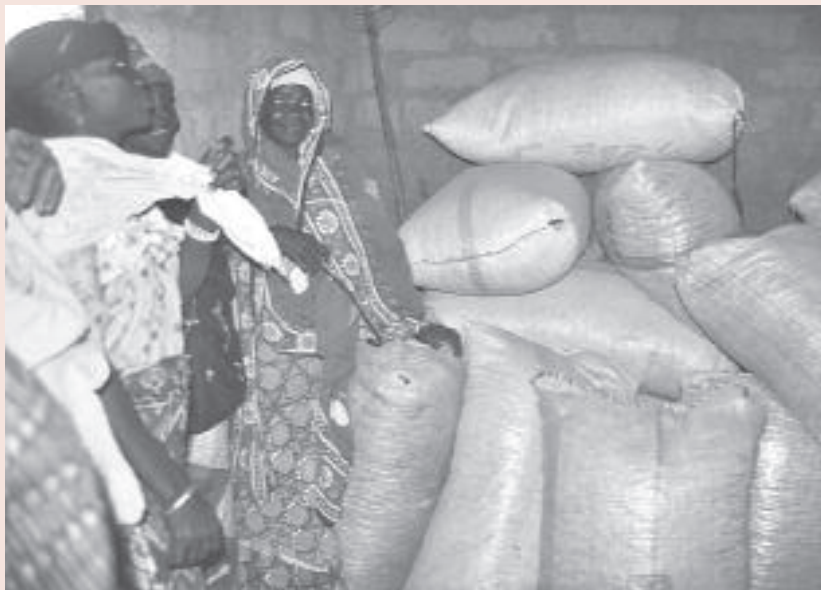
Graanbanken in het Niger

Verschillende van u hebben dat gedaan en deze verspreid onder vrienden en kennissen. Op hun beurt hebben enkele van deze mensen ons weer een donatie gedaan. Zo slaan we twee vliegen in klap. We vergroten onze inkomsten en we vergroten onze kring van vrienden. Mocht u nog folders willen bestellen of extra exemplaren van onze Nieuwsbrief om uit te delen, neem dan even