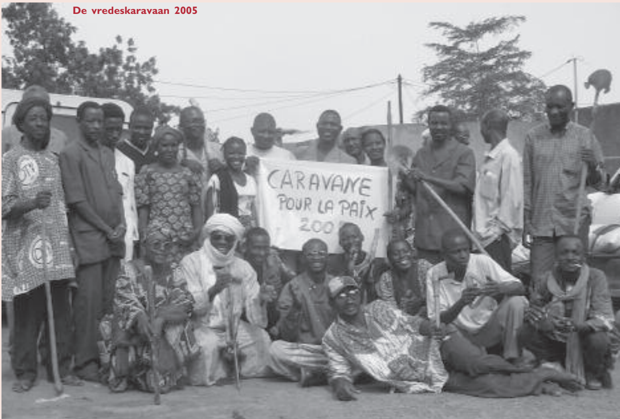
De vredeskaravaan 2005