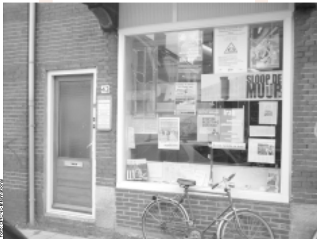
Ons EIRENE -kantoor in Utrecht

EIRENE was voor mij in die zin een thuisvoelen; al deze aspecten kwamen samen: spiritualiteit, mensenrechten, ontwikkelingswerk, verbondenheid, werken in je eigen leven en werken en uitwisseling over de grenzen van landen en culturen.