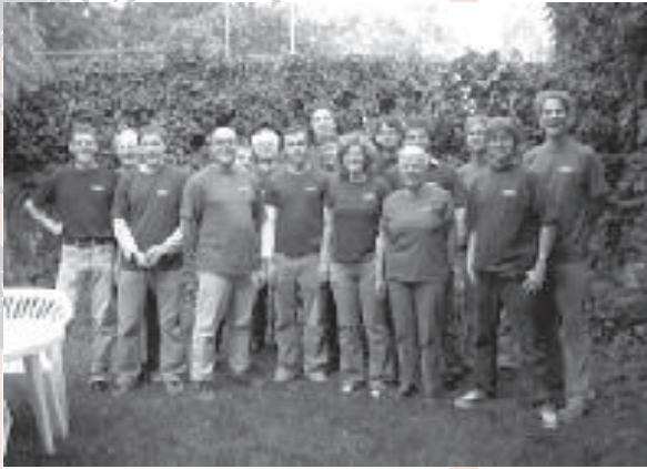
De Deelnemers van het seminar

„Ist ein Reverseprogramm bei EIRENE möglich?“ voor zijn doctoraalopdracht had gekozen is dit onderwerp bij EIRENE weer een beetje op de voorgrond geraakt.