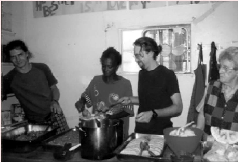
Vrijwilligers zijn voor veel sociale instellingen in de V.S. onmisbaar

de rest van de wereld over Amerika heeft. Het ene is cliché, het andere de realiteit van miljoenen Amerikaanse burgers. James kennen we van de Hollywood film. Michael kan je iedere avond in levende lijve tegenkomen als je door de straten van San Francisco loopt. Hier aan de westkust van Amerika zijn vele Michaels, die op het eerste gezicht meestal weinig opvallends vertonen. De armoede is verborgen en wordt pas zichtbaar bij een scherpere blik.