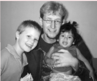
Ook families raken in de V.S. snel dakloos. In het project 'Tri-City Homeless' krijgen ze eerste opvang

Het is ook wat ik zag in de eerste weken, in mijn project 'Tri City Homeless' en mijn woonplaats Freemont in de Area Baai. Er zijn hier meer villa's dan in heel Duitsland. De auto's zijn met chroom versierd en meestal groter dan die op de Duitse wegen. De binnenstad geeft een gepolijste indruk en is mooi gerenoveerd. Dit is het beeld dat de gelegheidsbezoeker meestal mee naar huis neemt. In het begin zag ook ik alleen die rijkdom en keek ik over al die problemen zoals dakloosheid heen. Maar omdat ik hier een jaar kan blijven heb ik ook dat andere Amerika leren kennen.