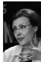
Wieczorek-Zeul Minister van Ontwikkelings- samenwerking in Duitsland

Hoewel dit heel iets anders lijkt, zou een dergelijk mensenrechtenfonds wel goed aan kunnen sluiten bij met name het burger vredeswerk zoals dat door Peace Brigades International