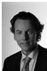
Bert Koenders Minister van Ontwikkelings- samenwerking

Zo'n opmerking is wat ons betreft dan natuurlijk niet tegen dovemansoren gericht. We hebben hem direct een brief geschreven waarbij we hem alle relevante informatie hebben toegestuurd en waarin we zijn Duitse collega, mevrouw Wieczorek-Zeul, hebben aangehaald toen zij op de Civil Peace Service Conference "Reality and Vision" van 20 april jl. in het gebouw van de Duitse Bondsdag in Berlijn stelde dat "Staten vaak hebben bewezen niet in staat te zijn om gewapende conflicten te voorkomen en tot een einde te brengen. Militaire "oplossingen" kunnen de grondoorzaken van het conflict niet oplossen. Vrede kan niet aan mensen worden opgelegd maar moet ontwikkeld worden. Er zijn geen gemakkelijke oplossingen waar de oorzaken van conflicten complex zijn en een combinatie van verschillende spelers en slecht ge-