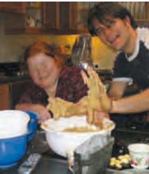
Europa, Europe, Europe