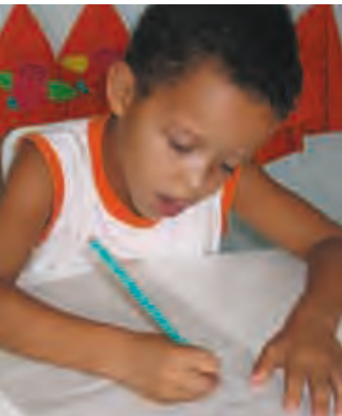
Lateinamerika, Amérique Latin, Latin America