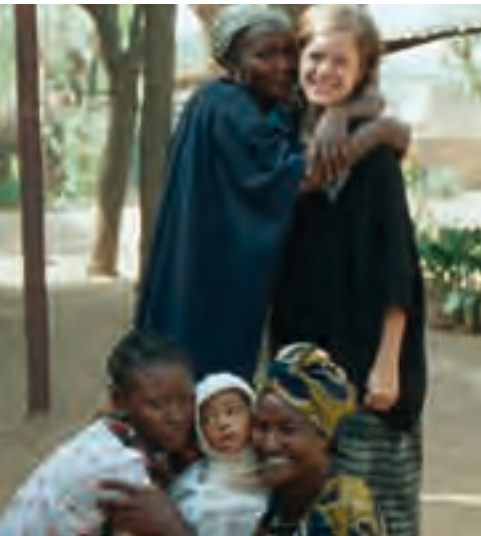
Afrika, Afrique, Africa